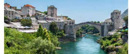
Assisi (Italien) und Mostar (Bosnien)