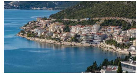
Bucht von Neum