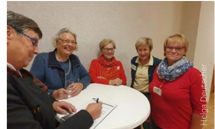
Ausbildung zur Besuchsbegleiterin/ zum Besuchsbegleiter

gen, Gesellschaftsspiele spielen, Rätsel lösen, Gedächtnisübungen machen, ... und manchmal geht es auch einfach nur um die Präsenz, ein bewusstes „Ich bin für dich jetzt mit meiner ganzen Aufmerksamkeit da, ich höre dir zu!“.