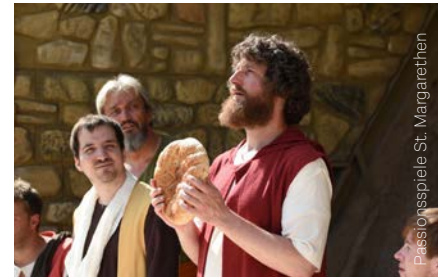
Brot brechen beim Abendmahl