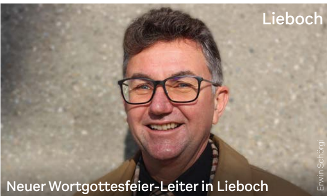
Neuer Wortgottesfeier-Leiter in Lieboch