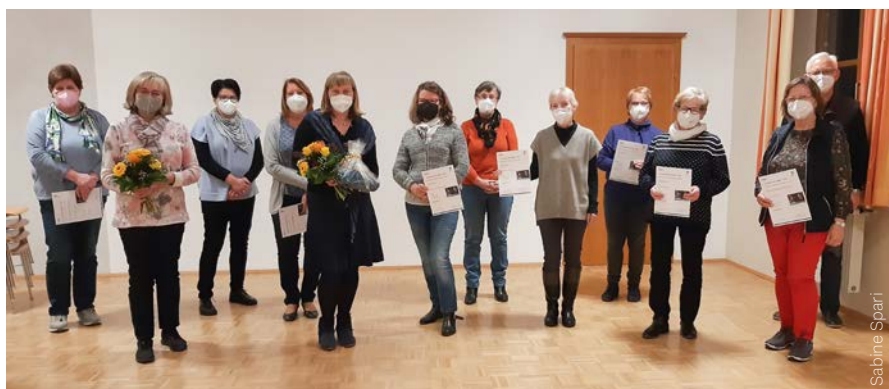
Zertifikatsverleihung der Besuchsdienstausbildung am 18.11.2021