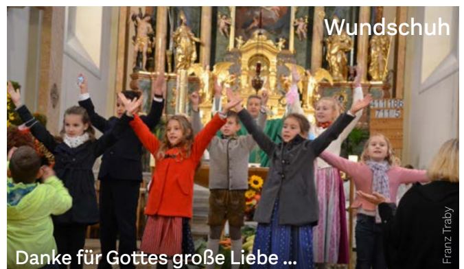
Danke für Gottes große Liebe ...