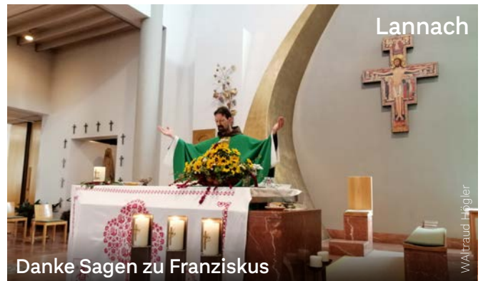
Danke Sagen zu Franziskus