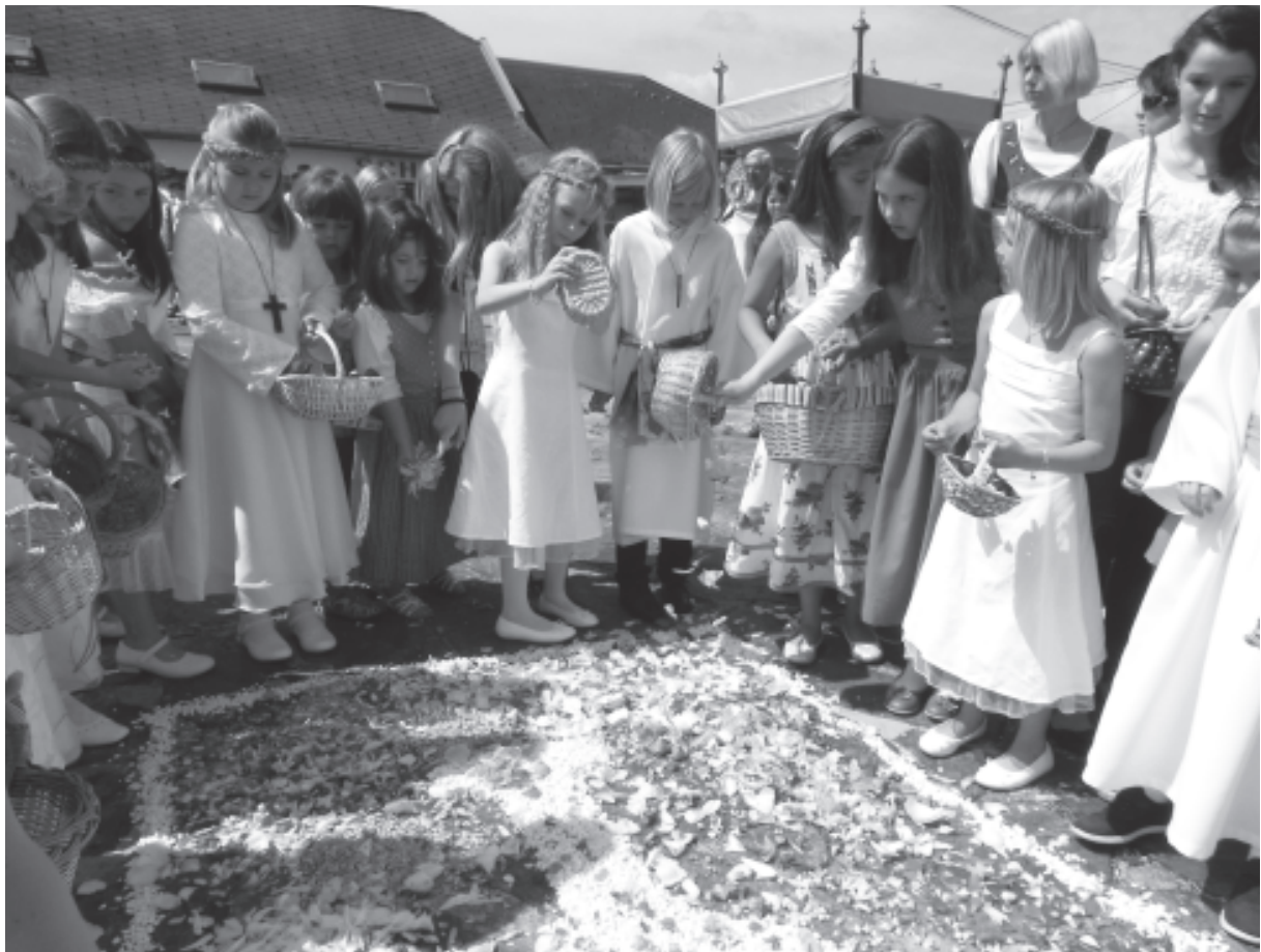
Auf Grund des diesjährigen schlechten Wetters musste die Redaktion auf ein Bild aus 2012 zurück greifen.