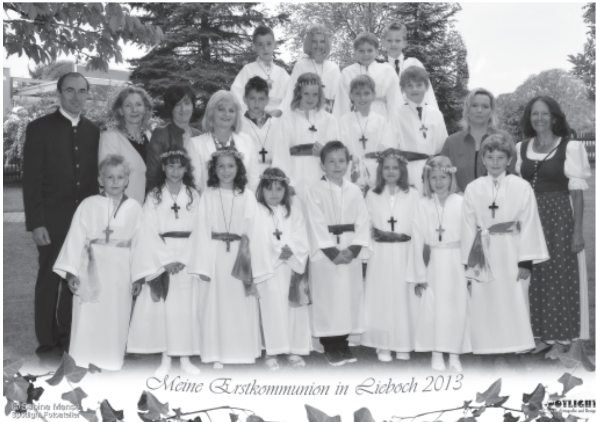
2. a Klasse