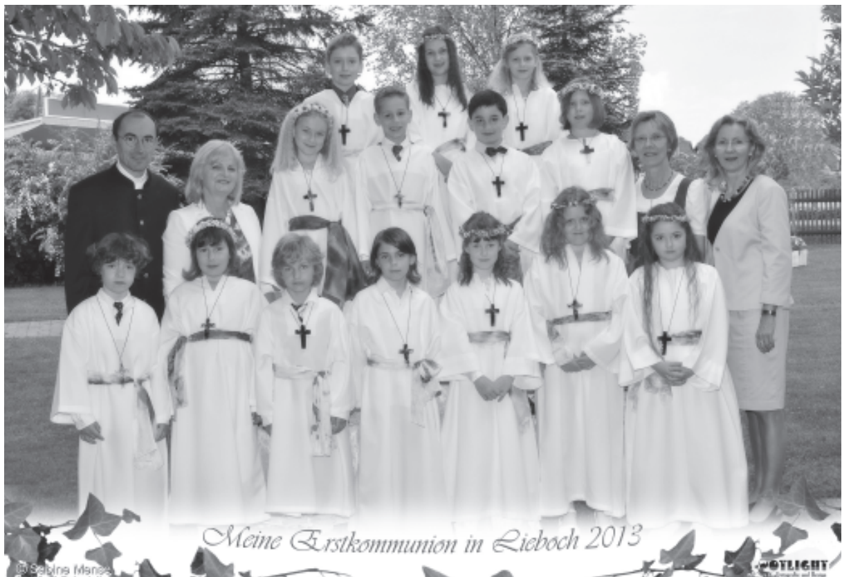
2. b Klasse