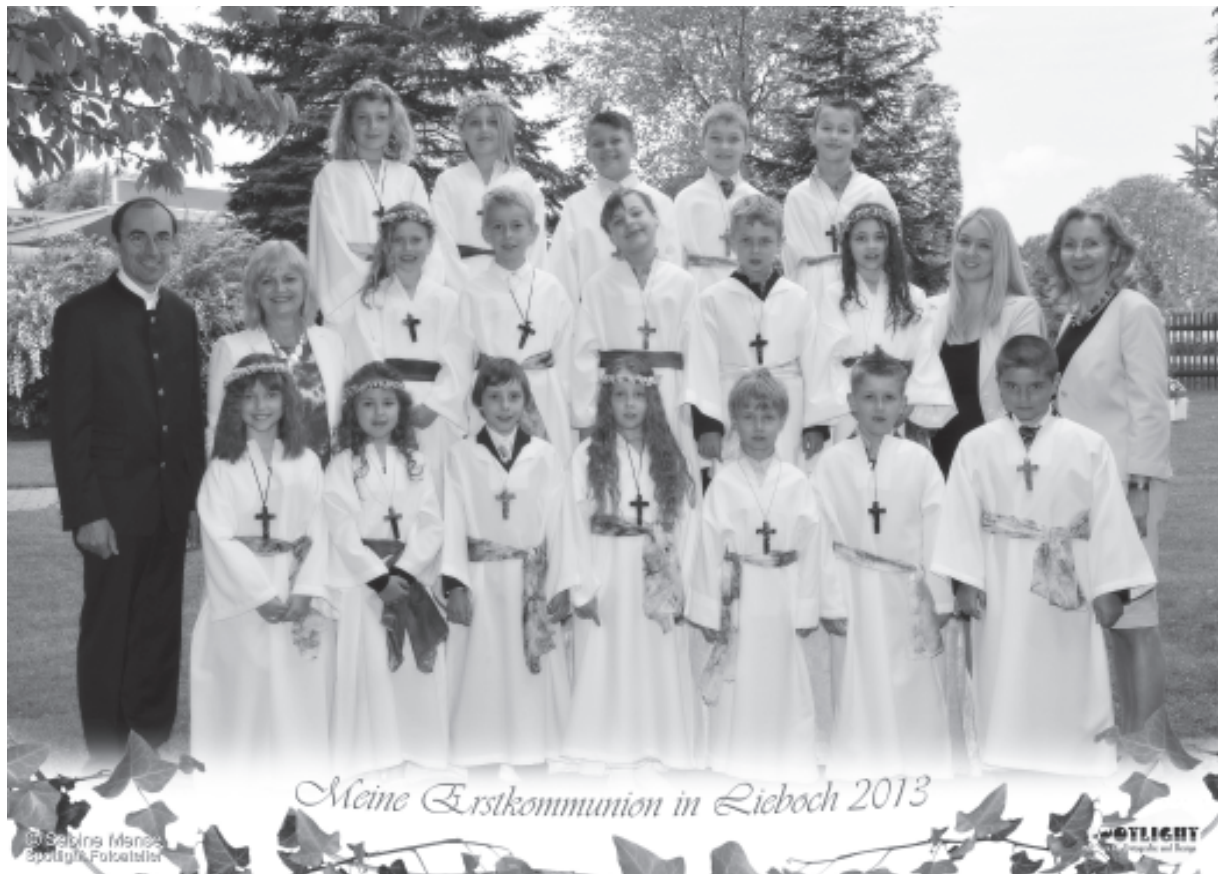
2. c Klasse